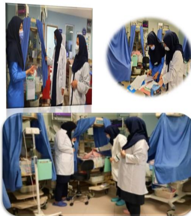
بازدید تیم مدیریتی پرستاری از بخش NICU ۱۴۰۰/۳/۲۷